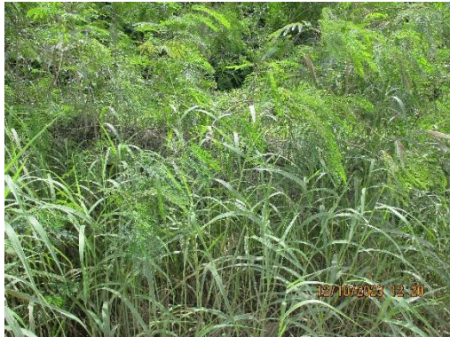
รูปที่ 2-35 ปุ่มพืชคลุมดินบริเวณพื้นที่โครงการ

โครงการเหมืองแร่หินอุตสาหกรรมชนิดหินปูน เพื่ออุตสาหกรรมปูนซีเมนต์ สำหรับแปลงคำขอประทานบัตรที่ 12/2556 ร่วมแผนผังโครงการทำเหมืองเดียวกันกับคำขอประทานบัตรที่ 13/2556, คำขอประทานบัตรที่ 14/2556, คำขอประทานบัตรที่ 15/2556, คำขอประทานบัตรที่ 16/2556 และคำขอประทานบัตรที่ 17/2556 และประทานบัตรที่ 27340/14390 ประทานบัตรที่ 27341/14391 และประทานบัตรที่ 27348/14392 ของบริษัท ทีพีโอ โพลีน จำกัด (มหาชน) ระหว่างเดือนกรกฎาคม-ธันวาคม พ.ศ. 2566