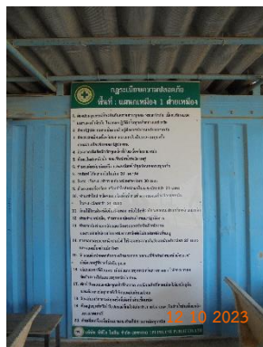
รูปที่ 2-26 ป้ายประกาศด้านความปลอดภัยและข่าวสารต่างๆ ในพื้นที่เหมือง