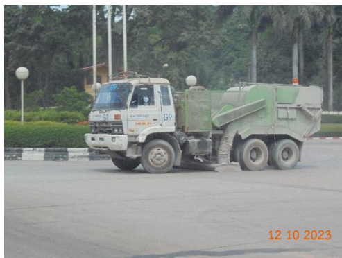
รูปที่ 2-14 รถดูดฝุ่นทำความสะอาดฝุ่นบริเวณลานหน้าประตู 3