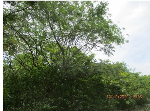
รูปที่ 2-13 การปลูกไม้ยืนต้นโตเร็วประจำถิ่นบริเวณขอบเขตพื้นที่โรงโม่บด และย่อยหิน