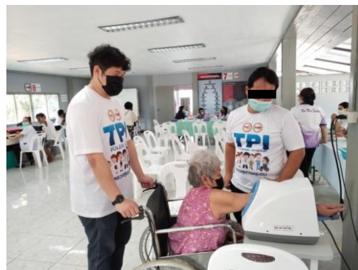
รูปที่ 2-32 การออกหน่วยแพทย์เคลื่อนที่ และการตรวจสุขภาพ