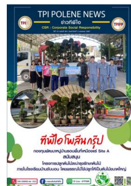
รูปที่ 2-40 โครงการปลูกต้นไม้และบำรุงรักษาบริเวณโรงเรียนบ้านซับสนอน