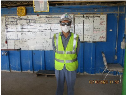
รูปที่ 2-12 การสวมใส่อุปกรณ์ป้องกันอันตรายส่วนบุคคลของพนักงาน

โครงการเหมืองแร่หินอุตสาหกรรมชนิดหินปูน เพื่ออุตสาหกรรมปูนซีเมนต์ สำหรับแปลงคำขอประทานบัตรที่ 12/2556 รวมแผนผังโครงการทำเหมืองเดียวกันกับคำขอประทานบัตรที่ 13/2556, คำขอประทานบัตรที่ 14/2556, คำขอประทานบัตรที่ 15/2556, คำขอประทานบัตรที่ 16/2556 และคำขอประทานบัตรที่ 17/2556 และประทานบัตรที่ 27340/14390 ประทานบัตรที่ 27341/14391 และประทานบัตรที่ 27348/14392 ของบริษัท ทีพีโอ โพลีน จำกัด (มหาชน) ระหว่างเดือนกรกฎาคม-ธันวาคม พ.ศ. 2566