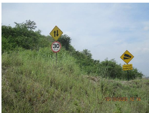
รูปที่ 2-16 ป้ายกำหนดความเร็วของยานพาหนะในพื้นที่โครงการ ไม่เกิน 30 กม./ชม.