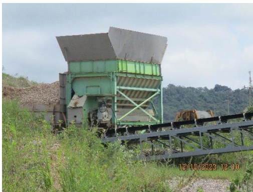
รูปที่ 2-9 โรงย่อยหินแบบ Semi Mobile Crusher