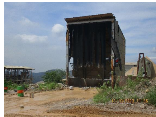
รูปที่ 2-10 เครื่องย่อยหินปูน (Limestone Crusher)