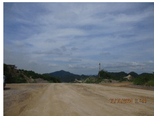
รูปที่ 2-15 ใช้ประโยชน์มูลดินในการปรับปรุงไหล่ทาง และเส้นทางบริเวณหน้าเหมือง