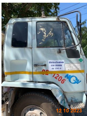
รูปที่ 2-28 เบอร์โทรศัพท์ หรือรายละเอียดที่สามารถแจ้งข้อร้องเรียนที่เห็นชัดเจน ข้างรถบรรทุกแร่ของโครงการ