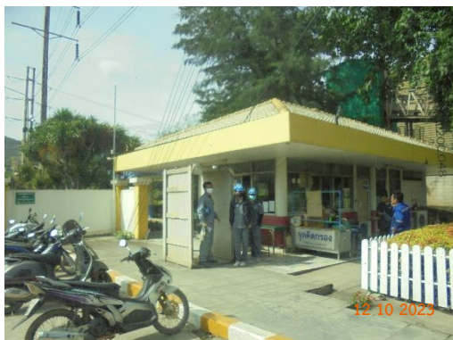
รูปที่ 2-1 อาคารติดต่อและรับเรื่องร้องทุกข์ ของบริษัท

ของบริษัท ทีพีโอ โพลีน จำกัด (มหาชน) ระหว่างเดือนกรกฎาคม-ธันวาคม พ.ศ. 2566