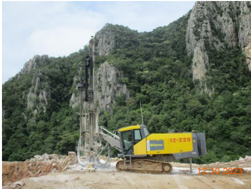
รูปที่ 2-7 เครื่องเจาะรูระเบิดที่มีระบบ Cyclone และถุงกรอง

โครงการเหมืองแร่หินอุตสาหกรรมชนิดหินปูน เพื่ออุตสาหกรรมปูนซีเมนต์ สำหรับแปลงคำขอประทานบัตรที่ 12/2556 ร่วมแผนผังโครงการทำเหมืองเดียวกัน กับคำขอประทานบัตรที่ 13/2556, คำขอประทานบัตรที่ 14/2556, คำขอประทานบัตรที่ 15/2556, คำขอประทานบัตรที่ 16/2556 และคำขอประทานบัตรที่ 17/2556 และประทานบัตรที่ 27340/14390 ประทานบัตรที่ 27341/14391 และประทานบัตรที่ 27348/14392 ของบริษัท ทีพีโอ โพลีน จำกัด (มหาชน) ระหว่างเดือนกรกฎาคม-ธันวาคม พ.ศ. 2566