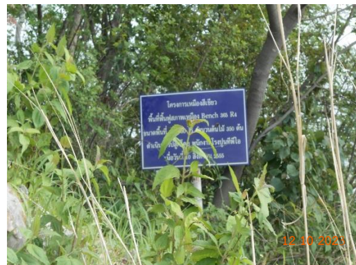
รูปที่ 2-38 การฟื้นฟูพื้นที่ที่ผ่านการทำเหมือง