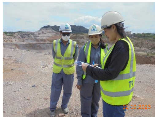
รูปที่ 2-2 การติดตามตรวจสอบตามมาตรการ ป้องกันและแก้ไขผลกระทบสิ่งแวดล้อม