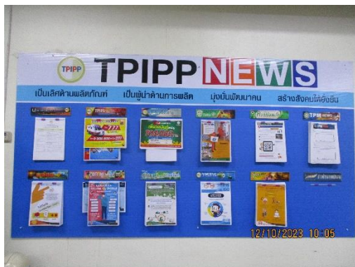
รูปที่ 2-31 บอร์ดประชาสัมพันธ์ แสดงเกี่ยวกับข้อมูลโครงการ

โครงการเหมืองแร่หินอุตสาหกรรมชนิดหินปูน เพื่ออุตสาหกรรมปูนซีเมนต์ สำหรับแปลงคำขอประทานบัตรที่ 12/2556 ร่วมแผนผังโครงการทำเหมืองเดียวกันกับคำขอประทานบัตรที่ 13/2556, คำขอประทานบัตรที่ 14/2556, คำขอประทานบัตรที่ 15/2556, คำขอประทานบัตรที่ 16/2556 และคำขอประทานบัตรที่ 17/2556 และประทานบัตรที่ 27340/14390 ประทานบัตรที่ 27341/14391 และประทานบัตรที่ 27348/14392 ของบริษัท ทีพีโอ โพลีน จำกัด (มหาชน) ระหว่างเดือนกรกฎาคม-ธันวาคม พ.ศ. 2566