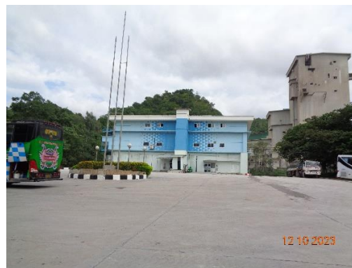
รูปที่ 2-19 ลานคอนกรีตเสริมเหล็ก บริเวณโรงงานปูนซีเมนต์และลานจอดรถบรรทุก