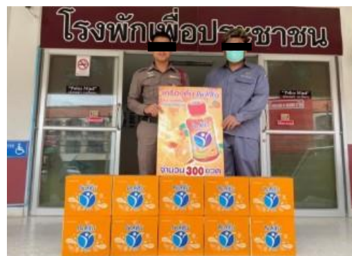
รูปที่ 2-30 การสนับสนุนกิจกรรมชุมชน