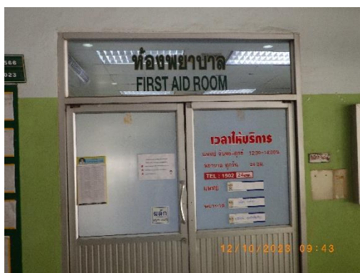
รูปที่ 2-34 ห้องพยาบาลและรถพยาบาลฉุกเฉิน