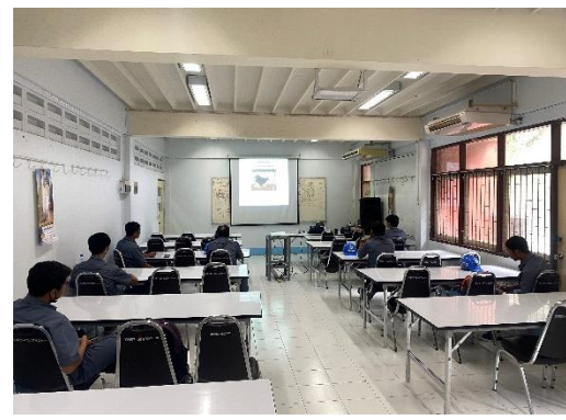
รูปที่ 2-27 การจัดอบรมพนักงานขับรถบรรทุกแร่