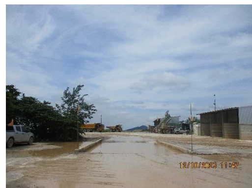
รูปที่ 2-17 บริเวณสำหรับการทำความสะอาดเศษดินเศษโคลนที่ติดตามรถบรรทุกแร่