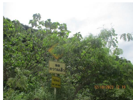
รูปที่ 2-29 ป้ายสัญญาณเตือนภัยบริเวณพื้นที่โครงการ