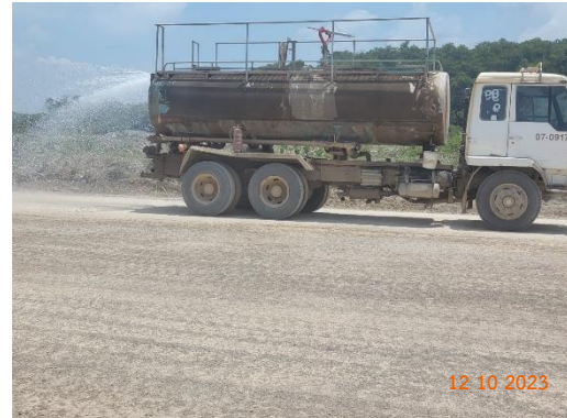
รูปที่ 2-8 การฉีดพรมน้ำ บริเวณพื้นที่โครงการ