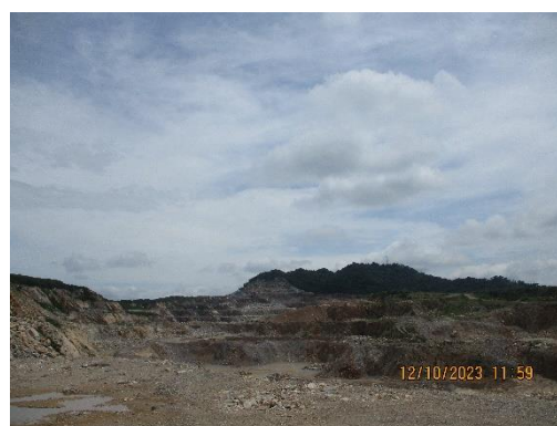
รูปที่ 2-23 ลักษณะการทำเหมืองแบบขั้นบันได