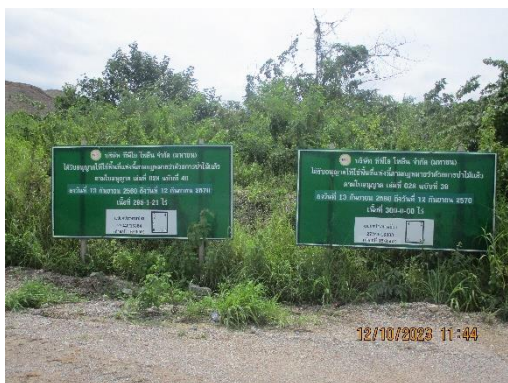
รูปที่ 2-3 ป้ายแสดงแผนผังพื้นที่โครงการ