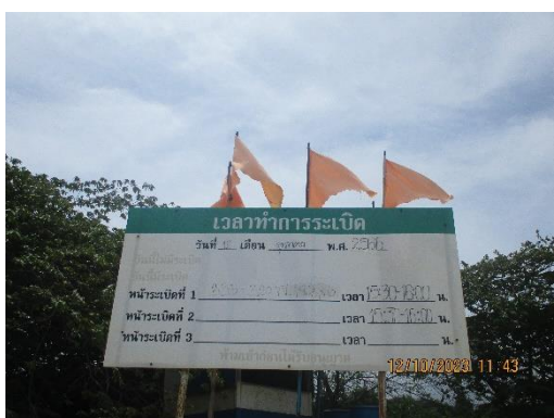
รูปที่ 2-22 ป้ายแจ้งวัน-เวลาระเบิด