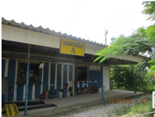
รูปที่ 2-24 สถานที่เก็บเครื่องมือและอุปกรณ์บริเวณพื้นที่โครงการ

โครงการเหมืองแร่หินอุตสาหกรรมชนิดหินปูน เพื่ออุตสาหกรรมปูนซีเมนต์ สำหรับแปลงคำขอประทานบัตรที่ 12/2556 ร่วมแผนผังโครงการทำเหมืองเดียวกันกับคำขอประทานบัตรที่ 13/2556, คำขอประทานบัตรที่ 14/2556, คำขอประทานบัตรที่ 15/2556, คำขอประทานบัตรที่ 16/2556 และคำขอประทานบัตรที่ 17/2556 และประทานบัตรที่ 27340/14390 ประทานบัตรที่ 27341/14391 และประทานบัตรที่ 27348/14392 ของบริษัท ทีพีโอ โพลีน จำกัด (มหาชน) ระหว่างเดือนกรกฎาคม-ธันวาคม พ.ศ. 2566