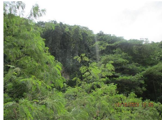
รูปที่ 2-25 เขตพื้นที่กั้นชน (Buffer zone)