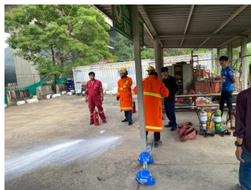
รูปที่ 2-33 การอบรมแก่พนักงานและผู้ควบคุมการ ดำเนินงาน ในเรื่องอาชีวอนามัยและความปลอดภัย