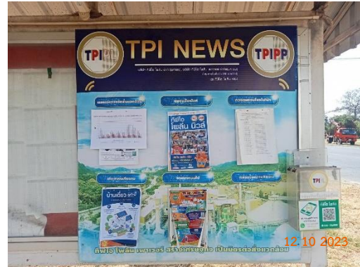
รูปที่ 2-36 การประชาสัมพันธ์ข้อมูลให้ประชาชนในชุมชนใกล้เคียงและหน่วยงานสาธารณสุข