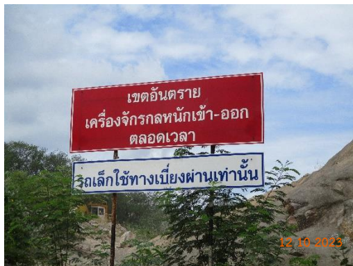
รูปที่ 2-37 ป้ายแสดงห้ามมิให้บุคคลภายนอกที่ไม่มีหน้าที่เกี่ยวข้องเข้ามา