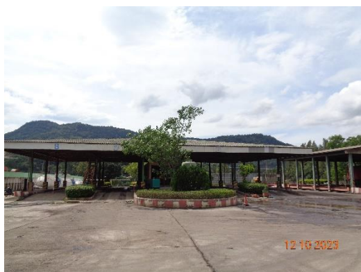
รูปที่ 2-20 พื้นที่สำหรับจอดรถบรรทุก รับ-ส่งวัตถุดิบในการผลิตซีเมนต์