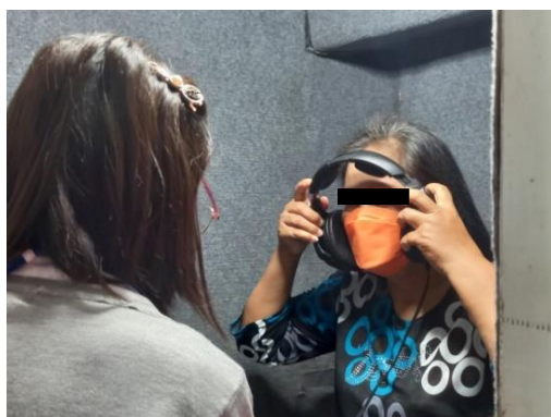
รูปที่ 2-32 (ต่อ) การออกหน่วยแพทย์เคลื่อนที่ และการตรวจสุขภาพ