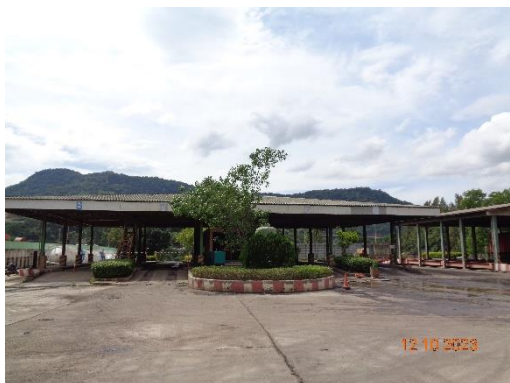
รูปที่ 2-18 เครื่องชั่งน้ำหนักบริเวณประตูที่ 3

โครงการเหมืองแร่หินอุตสาหกรรมชนิดหินปูน เพื่ออุตสาหกรรมปูนซีเมนต์ สำหรับแปลงคำขอประทานบัตรที่ 12/2556 ร่วมแผนผังโครงการทำเหมืองเดียวกัน กับคำขอประทานบัตรที่ 13/2556, คำขอประทานบัตรที่ 14/2556, คำขอประทานบัตรที่ 15/2556, คำขอประทานบัตรที่ 16/2556 และคำขอประทานบัตรที่ 17/2556 และประทานบัตรที่ 27340/14390 ประทานบัตรที่ 27341/14391 และประทานบัตรที่ 27348/14392 ของบริษัท ทีพีโอ โพลีน จำกัด (มหาชน) ระหว่างเดือนกรกฎาคม-ธันวาคม พ.ศ. 2566