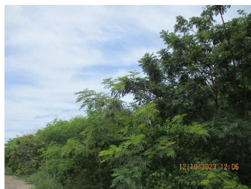
รูปที่ 2-6 การปลูกต้นไม้ทรงสูง ตามแนวเส้นทางขนส่งแร่ บริเวณพื้นที่โครงการ