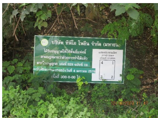
รูปที่ 2-5 ป้ายแสดงรายละเอียดของแปลงประทานบัตร บริเวณพื้นที่โครงการ