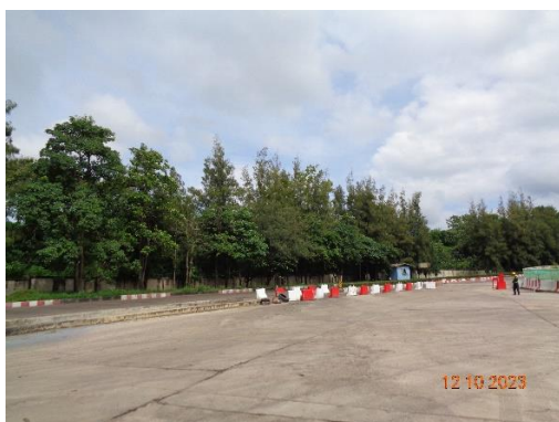
รูปที่ 2-39 ไม้ยืนต้นขนาดใหญ่บริเวณขอบเขตพื้นที่โครงการที่ต่อเนื่องกับโรงเรียนบ้านซับสนอน